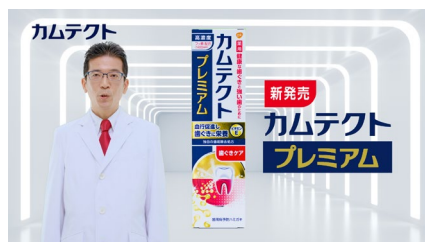
新カムテクトプレミアムは