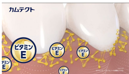
ビタミンEが、血行促進し栄養を届けます