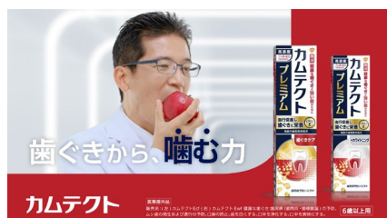
歯ぐきから、噛む力 カムテクト (カリッ)